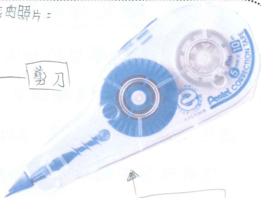
塗改帶 / 改錯帶